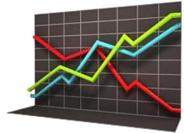
Новые предсказательные модели