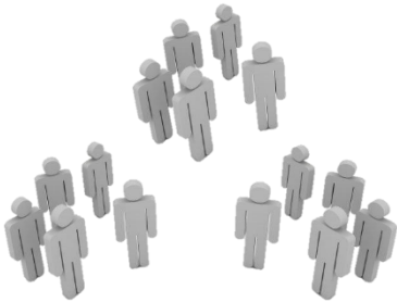
Новая аналитическая сегментация