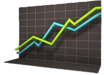
Текущие предсказательные модели