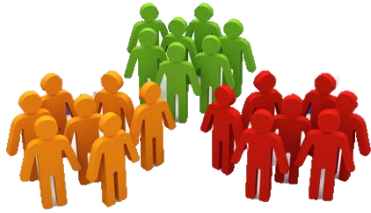
Текущая экспертная сегментация