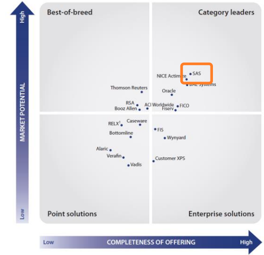
Решения по управлению рисками противоправных действий Chartis, март 2016