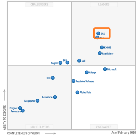
Платформы углублённой аналитики Gartner, февраль 2016