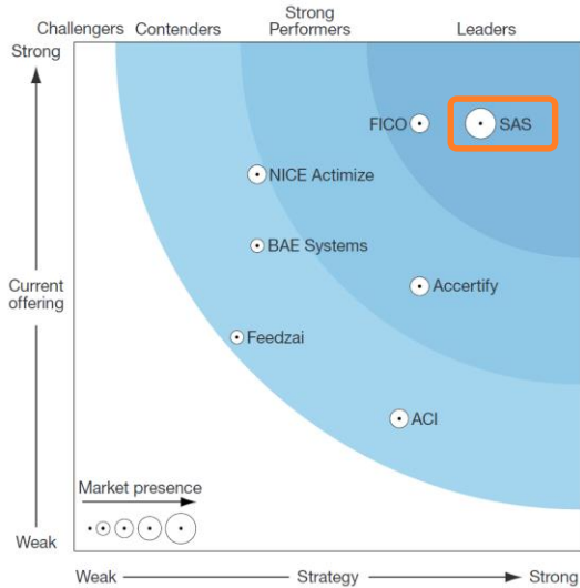
Платформы по управлению рисками нарушений законодательства Forrester, январь 2016