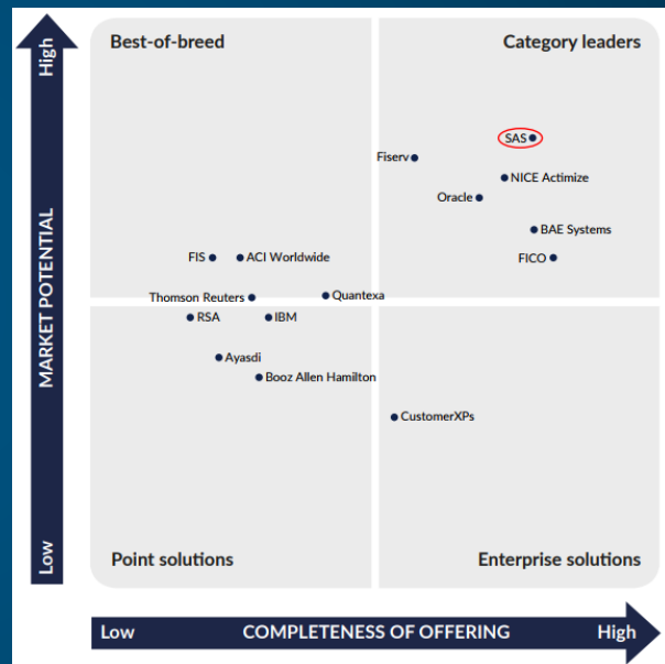
Решения по управлению рисками противоправных действий Chartis, март 2017