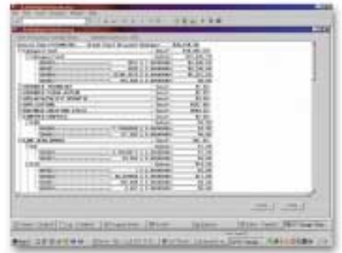
Einzelkostennachweis per Drill-Down

Im Rahmen der SAS Leistungsverrechnung bieten wir Ihnen außerdem Beratung, Implementierung und Schulung – um Ihnen auch langfristig eine effiziente Nutzung dieser Anwendung zu ermöglichen.