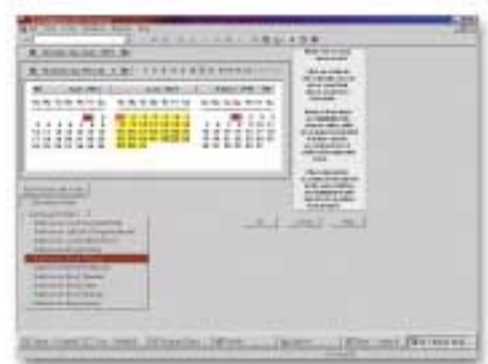
Frei wählbare Abrechnungsperioden bis auf Kostenstellenebene