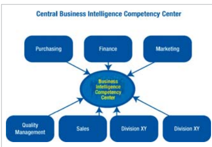
Obr. č. 2 Centrálné BICC

V prípade implementácie centrálného BICC sa musí definovať a nastaviť proces riadenia zmien na podporu tejto zmeny (pozri text ďalej).