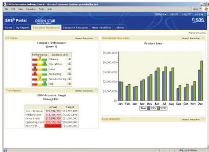
De SAS Portal biedt uitgebreide mogelijkheden voor het genereren van rapporten.