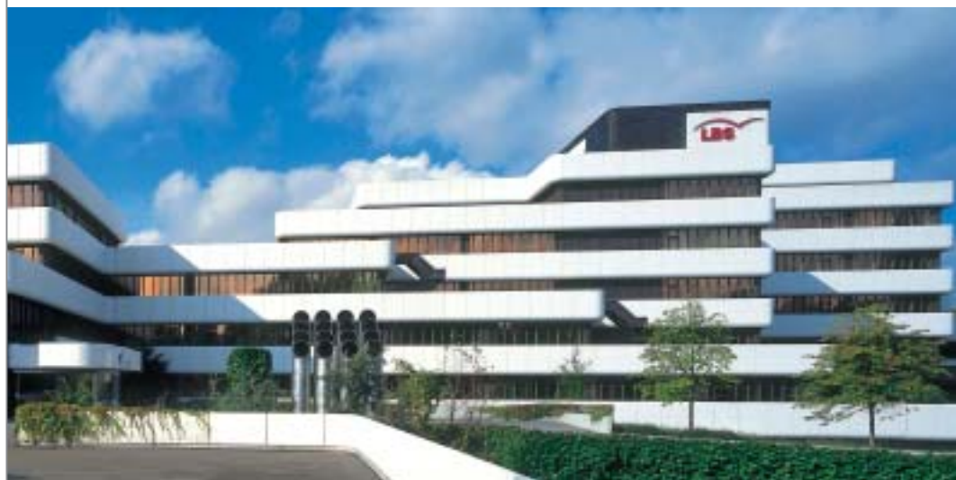
Die Zentrale der LBS West in Münster.

Flexibles Online-Reporting und -Controlling bei der LBS West